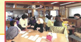
熱心なグループワーク