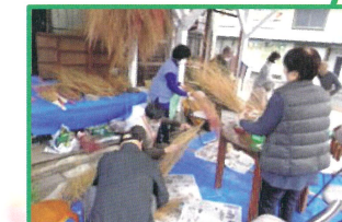
コキアのほうきづくり