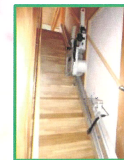
広い玄関と階段エレベーター