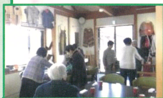
にぎわうギャラリーとかわいいお客様