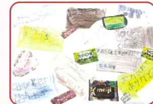
明治HD株主さんへ、園児からお礼の手紙