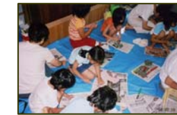
ねんどに熱中して遊ぶ子供達