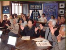
春のうたの広場を楽しむみなさん

“ねんどであそぼ”と、おばさんたちが楽しんだ“漆喰であそぼ”もなかなかの作品に仕上がって、全部で6回の事業をおいで屋で行ってきました。