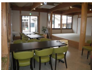
隣のティールーム