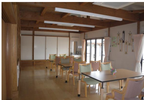
広くて明るい機能訓練室