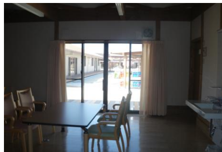
窓の外には子供たちの遊ぶ姿が…